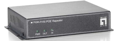
POR-0100 : 屋内用中継リピータ