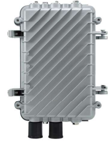
POR-1100 : 屋外用中継リピータ